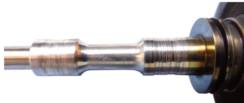
Rayures sur l'axe au niveau du palier